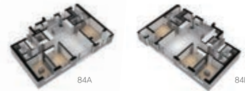
○ 84A/B type