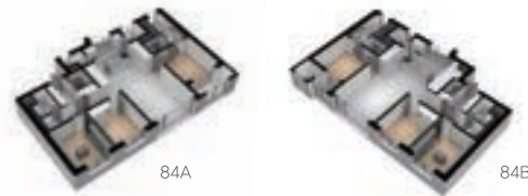
○ 84A/B type